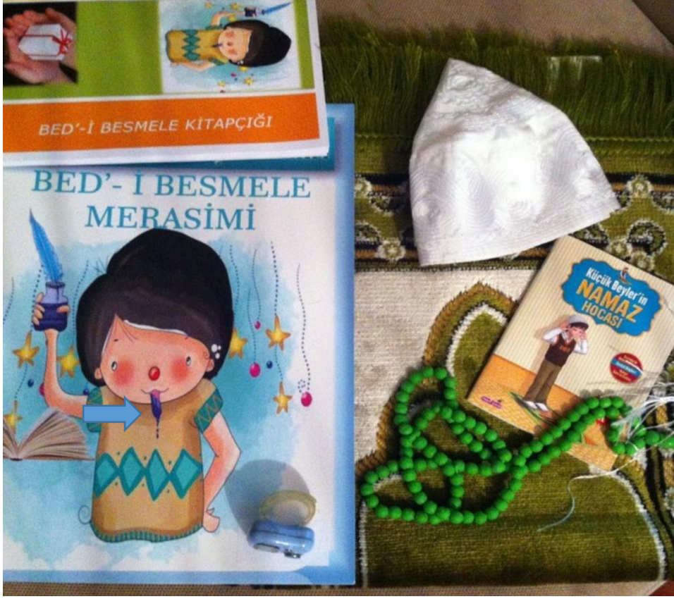
Ek 17. “ Bed’i Besmele Töreni Evde Yapılacak Bir Çocuk İçin Kitapçıktan Hareketle Hazırlanan Malzemeler” [17.02.2019]