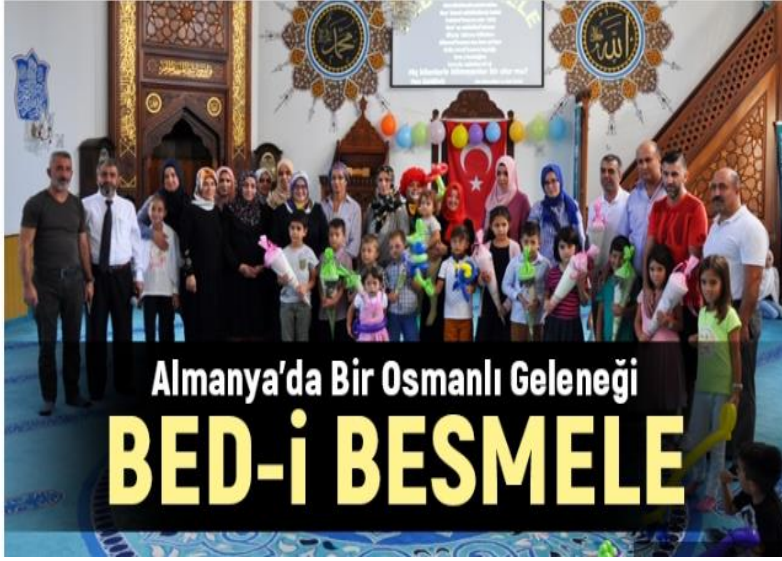
Ek 16. “Almanya’da Bed’i Besmele Töreni” [26.10.2019]