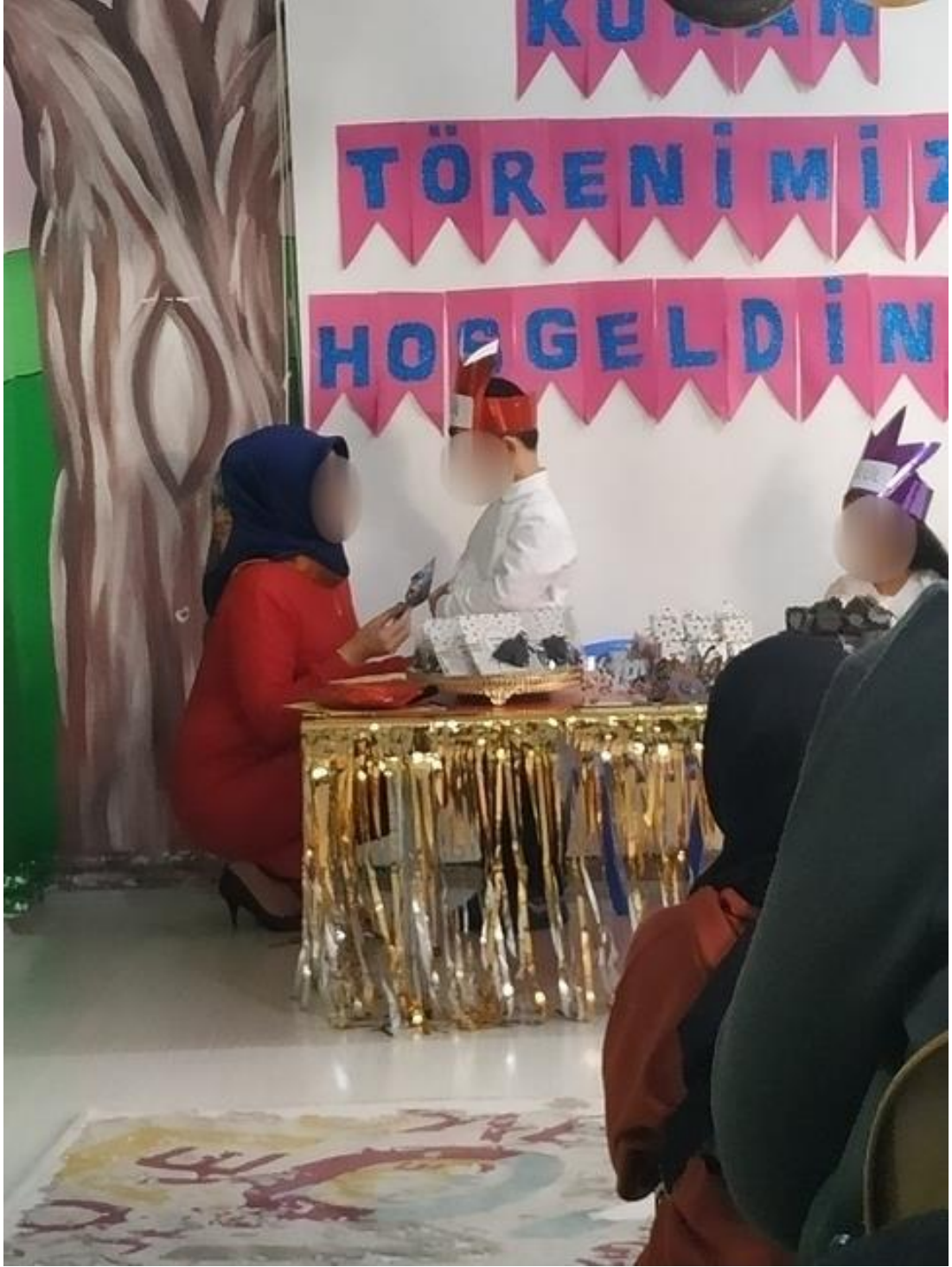
Ek 23. Kur'an'a Geçen Bir Çocuğa Hediyesi Takdim Edilirken.