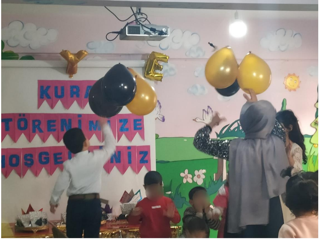
Ek 25. Özel Gaziosmanpaşa İlkadım Anaokulu'nda Yapılan Bir Törende Çocuklar Balonları Patlatıp İçindeki Şekerleri Toplarken.