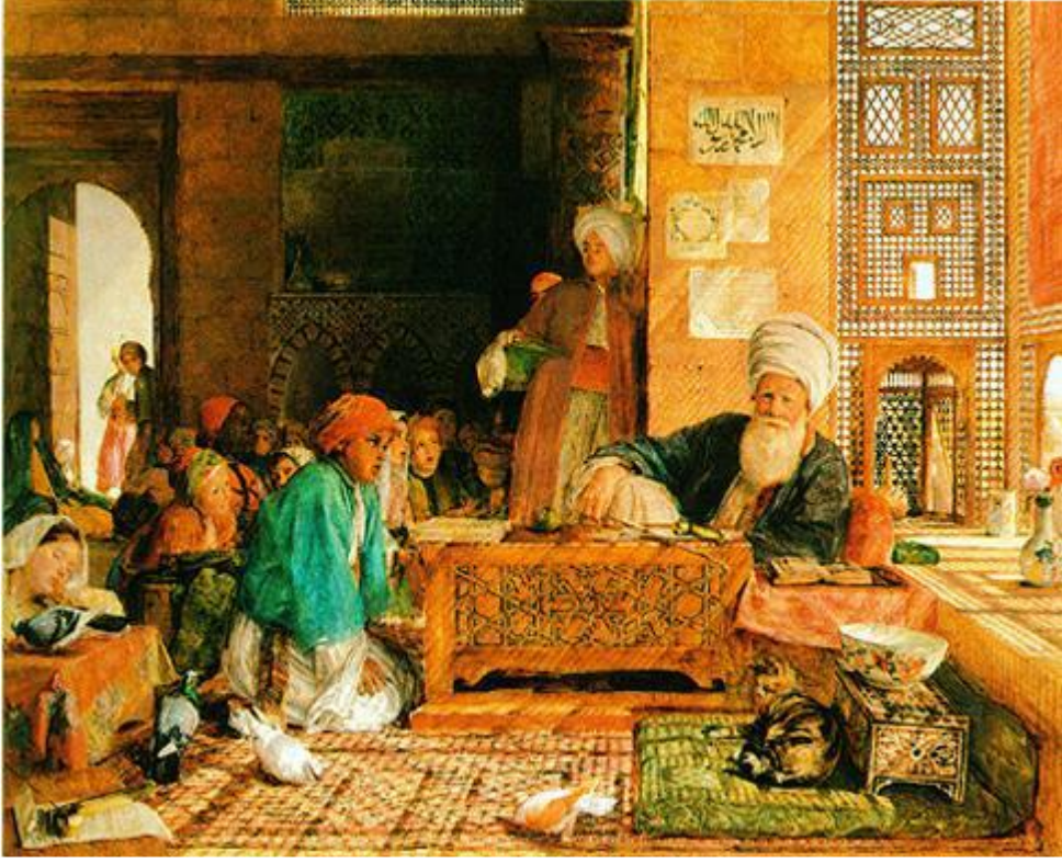
Ek 10. Kahire Sıbyan mektebinde Ders Dinleyen Talebeler (John Frederick Lewis'in Kahire'de Türk okulu Adlı Tablosu)