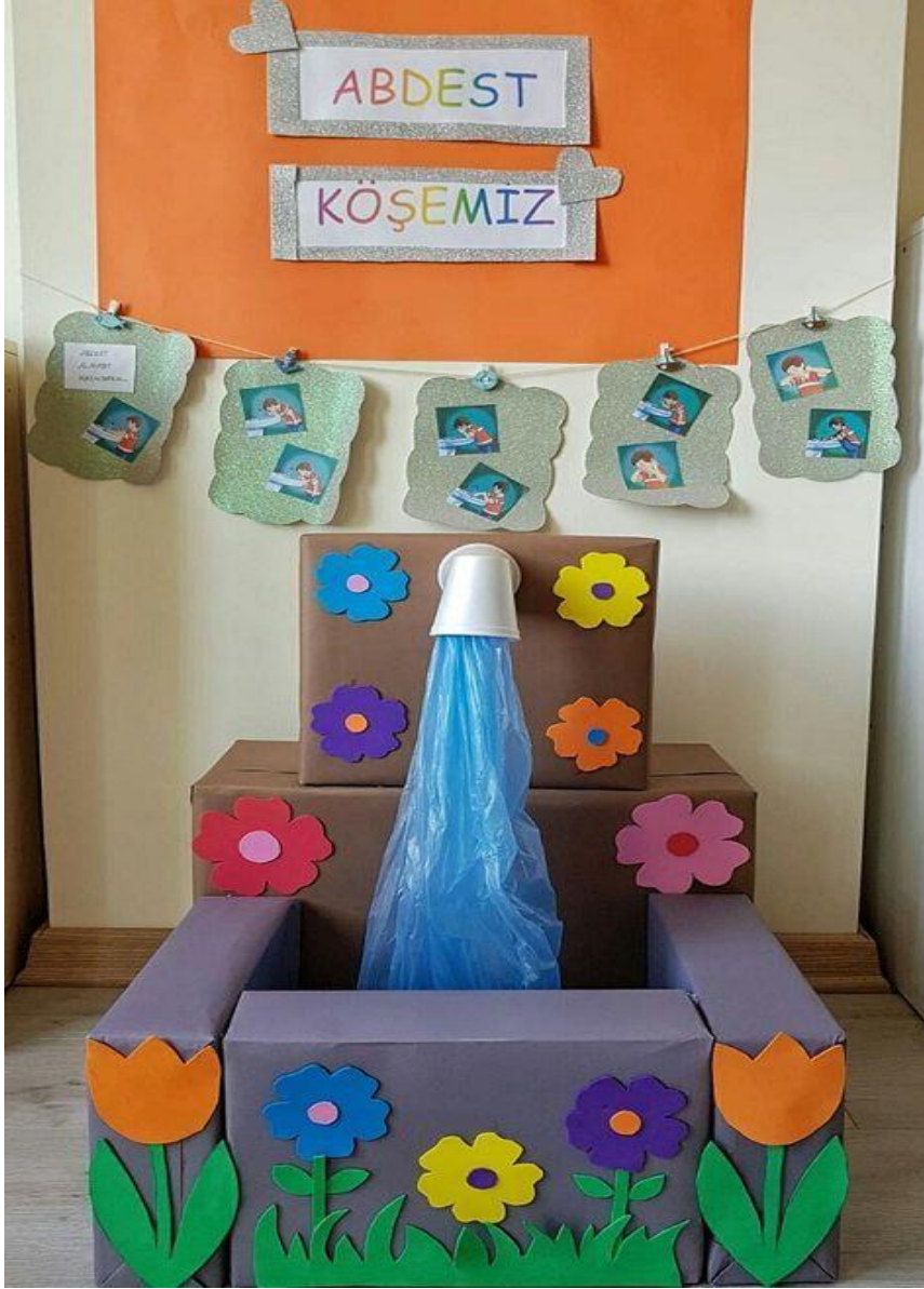
Ek 21. Özel Bir Kurumda Görev Yapmış Bir Öğretmen Tarafından Paylaşılan Görseldir.