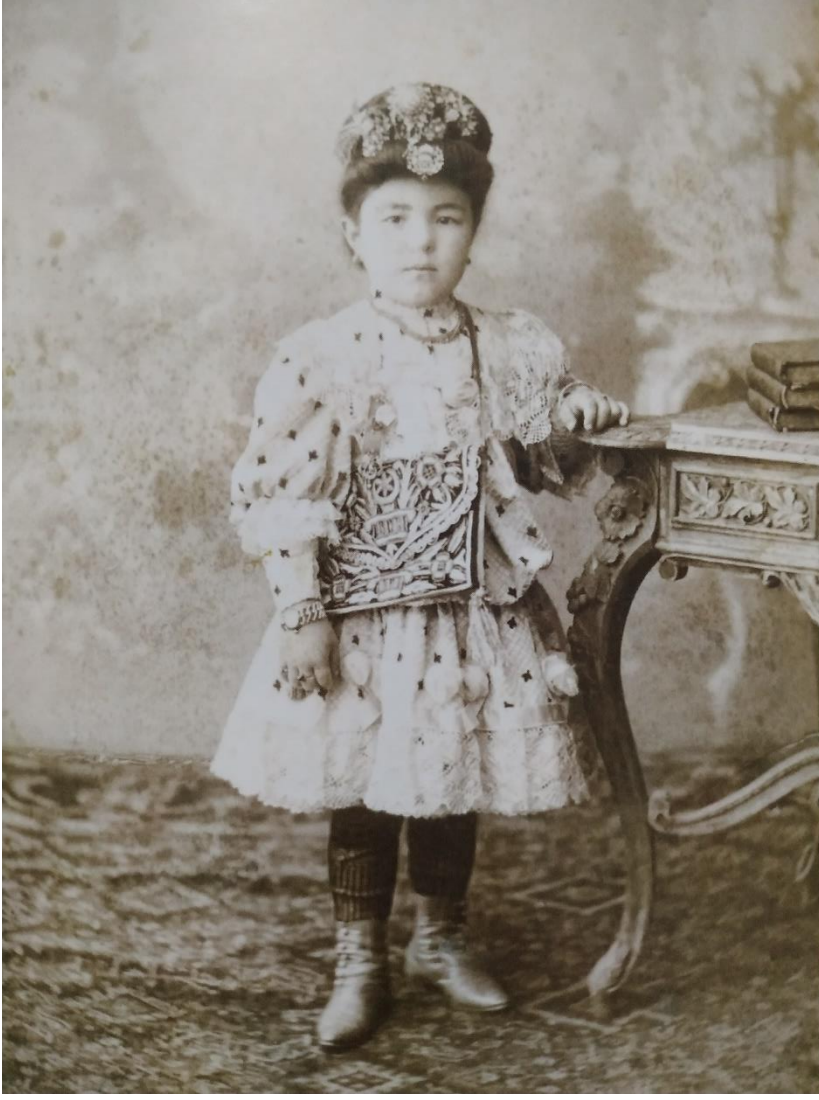
Ek 6. Bedi'-i Besmele Merasimi İçin Hazırlanmış Bir Kız Talebe (Fatih Güldal'ın Elifba'dan Muallime Mahalle Mektebi İsimli Eserinden)