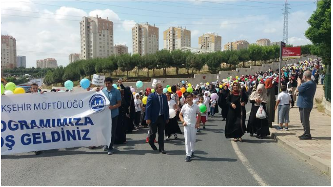
Ek 15. “Bedi’-i Besmele Töreni” Yaz Kur'an Kursları Açılış Programı https://istanbul.diyamet.gov.tr/basaksehir/Sayfalar/contentdetail.aspx?ContentId=489 &MenuCategory=Kurumsal [06.8.18]