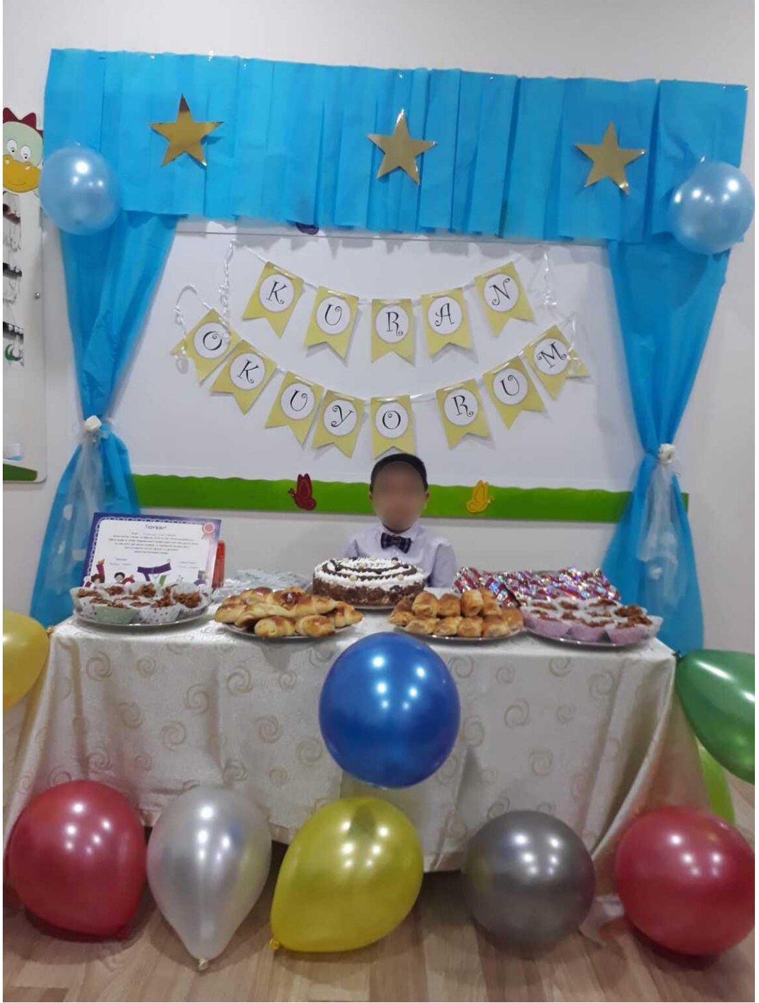
Ek 22. Kur'an'a Geçen Bir Çocuk İçin Düzenlenen Merasimden Bir Kare.