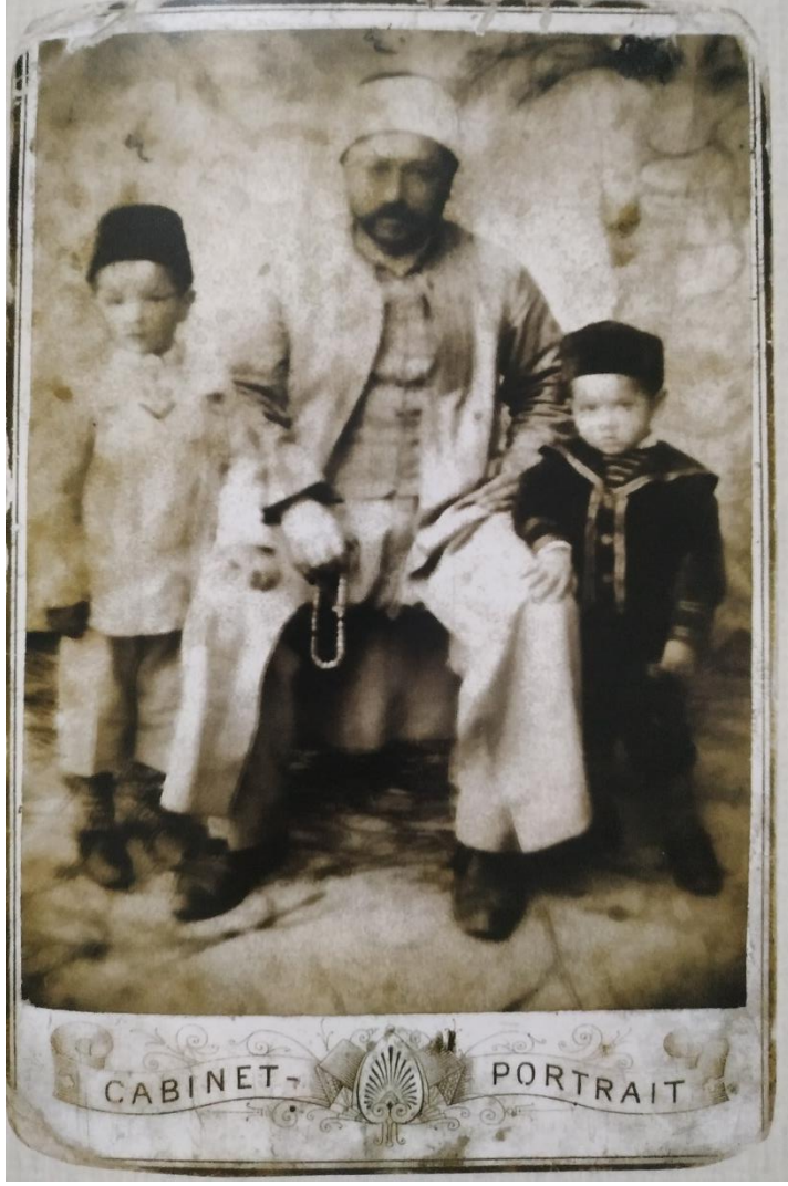
Ek 9. Sıbyan mektebi Talebeleri ve Hocaları (Fatih Güldal'ın Elifba'dan Muallime Mahalle Mektebi İsimli Eserinden)