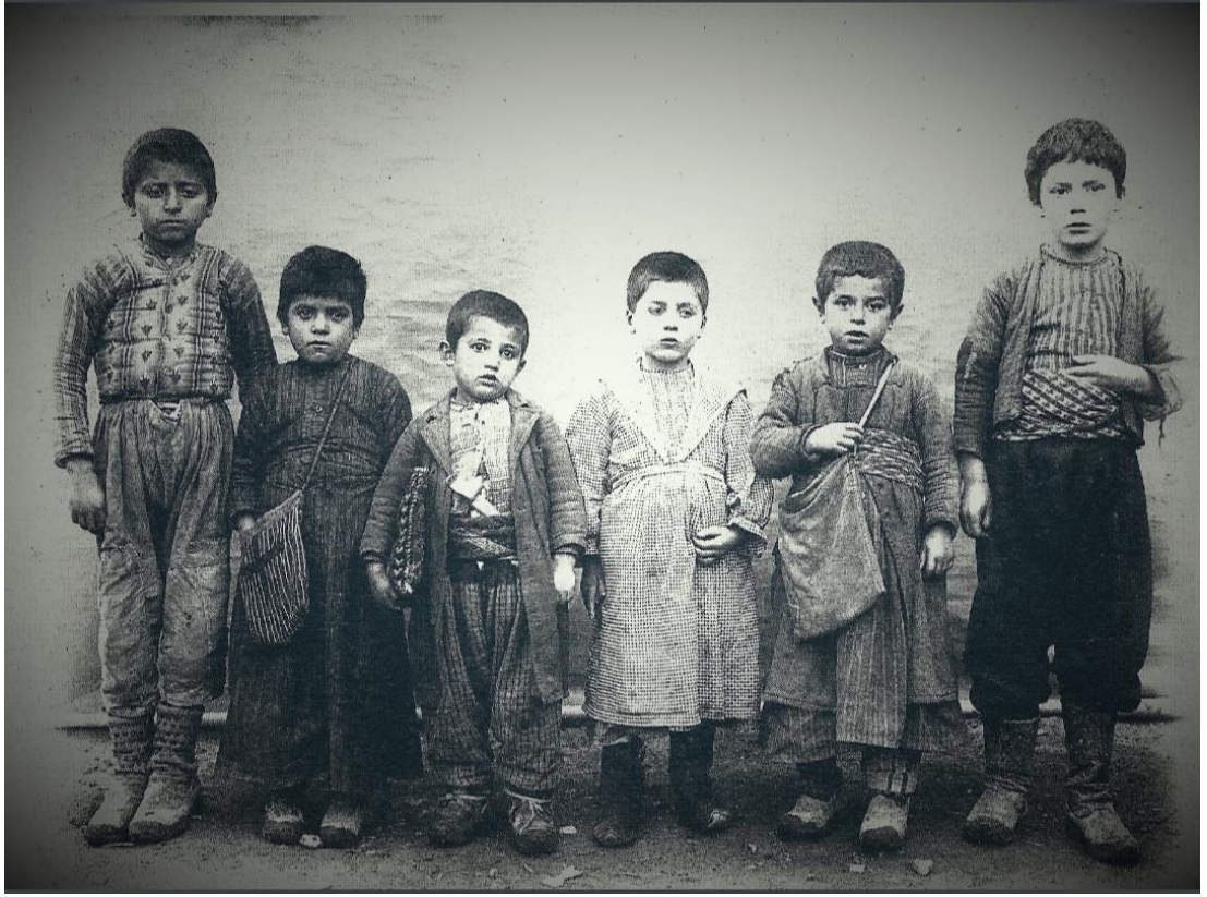
Ek 20. Tokat İli Sibyan Mektebi Talebeleri 1890'lı yıllar.