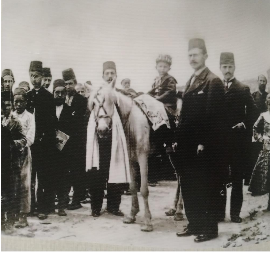
Ek 8. Âmin Alayı'nda Ata Bindirilen Çocuk (Fatih Gldal'ın Elifba'dan Muallime Mahalle Mektebi İsimli Eserinden)