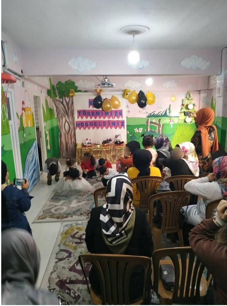
Ek 24. Özel Gaziosmanpaşa İlkadım Anaokulu'nda Yapılan Bir Törende Çocuklar Öğretmenleri Tarafından Seçilen İlahi Eşliğinde Hazırlanan Koreograflerini Sunarken.