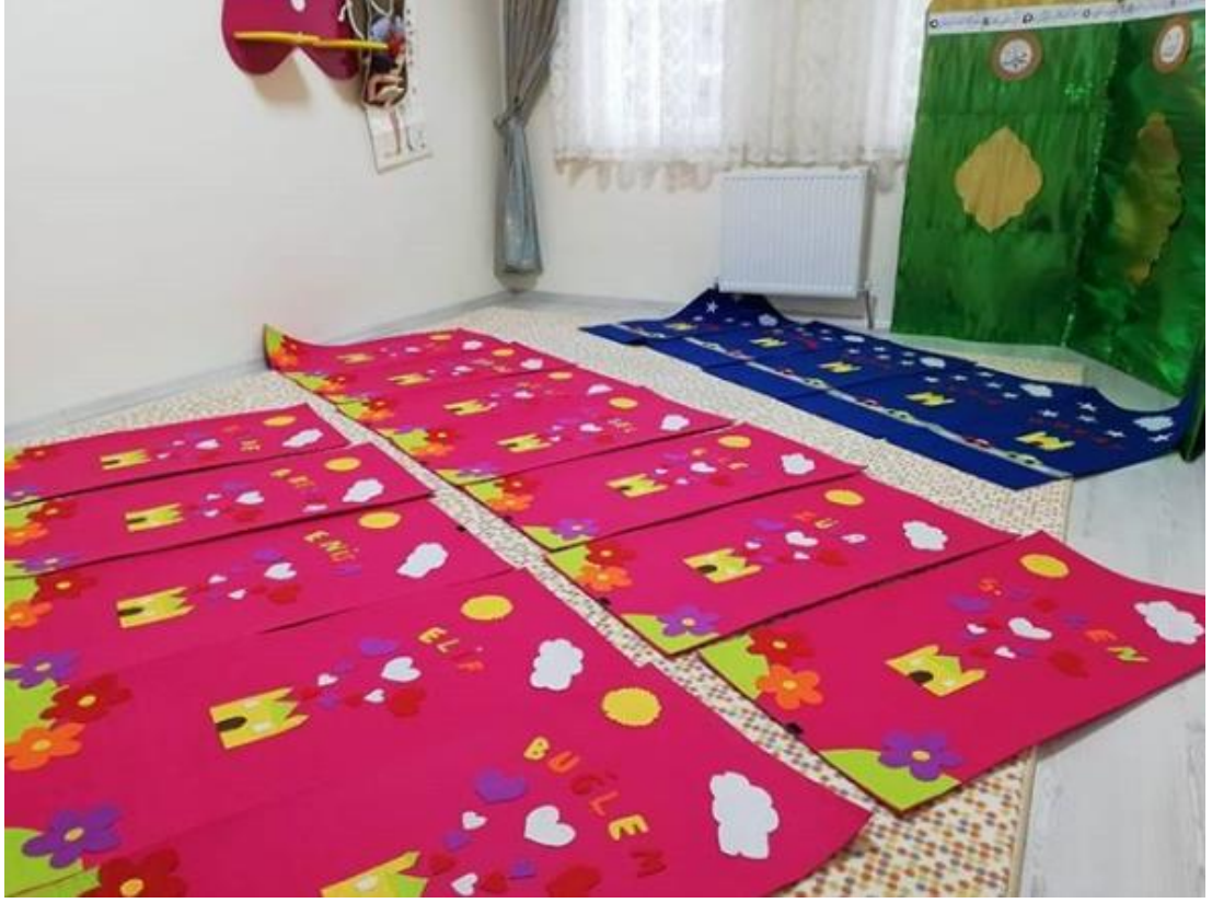
Ek 19. Çocuklara Uygulamalı Olarak Namaz Kılmayı Öğretmeden Önce Yapılan Hazırlık