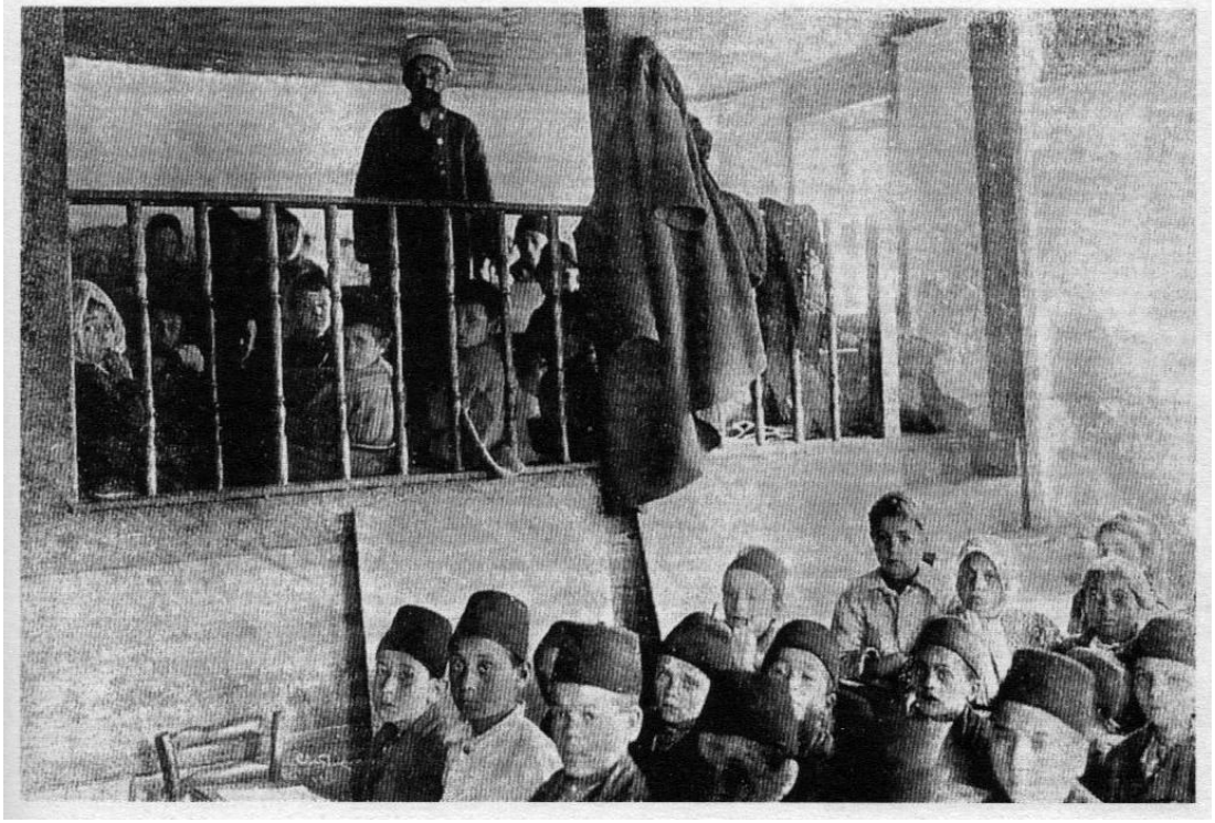
Ek 1. Tanzimat Sonrası Sıbyan mektebinde Ders Dinleyen Öğrenciler, İstanbul'da Bir Sıbyan mektebinde Öğrenciler (Sakaoğlu N. Osmanlıdan Günümüze Eğitim Tarihi İstanbul Bilgi Üniversitesi 2003)