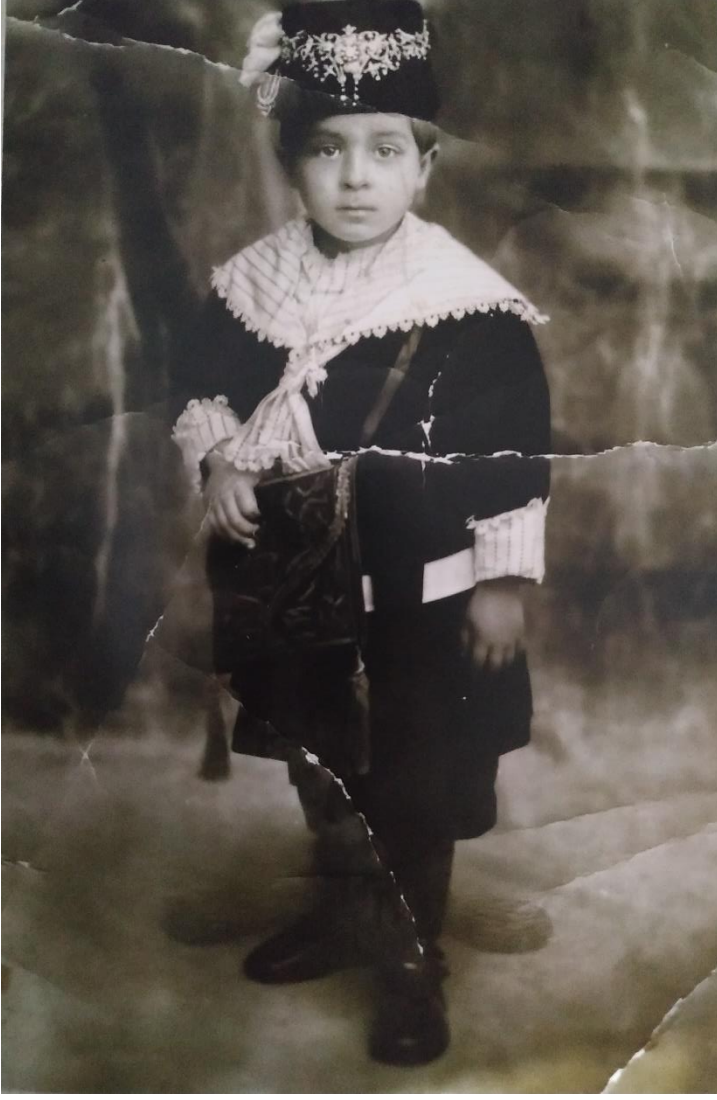
Ek 2. Merasim İin Hazırlanmıř ve Fesine Nazarlık Takılmıř Bir Erkek Talebe (Fatih Gldal'ın Elifba'dan Muallime Mahalle Mektebi İsimli Eserinden)