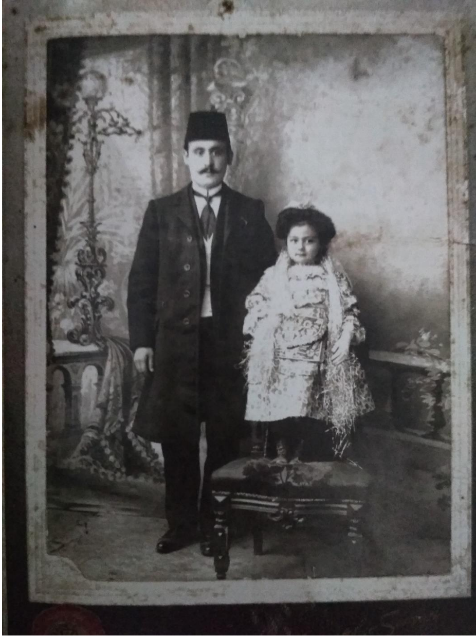
Ek 3. Bedi'-i Besmele Merasimi İçin Hazırlanmış, Boynuna Şal Takılmış Bir Kız Talebe ve Babası (Fatih Güldal'ın Elifba'dan Muallime Mahalle Mektebi İsimli Eserinden)