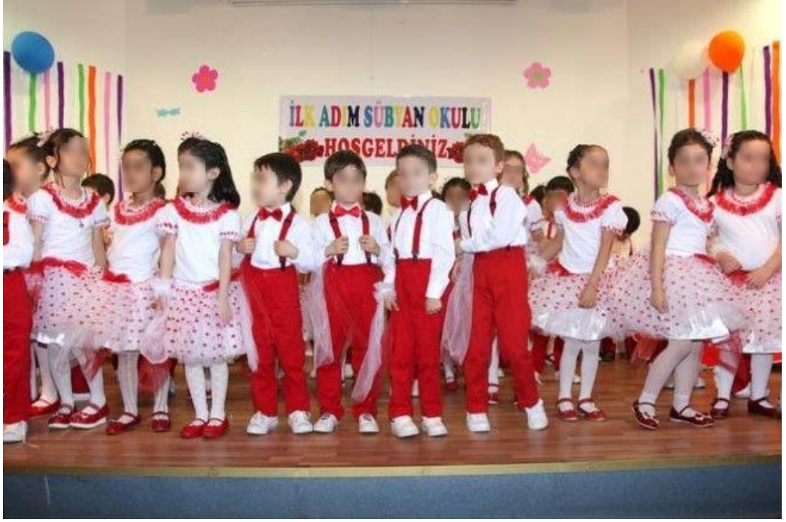
Ek 26. Yıl Sonu Merasiminden Bir Kare