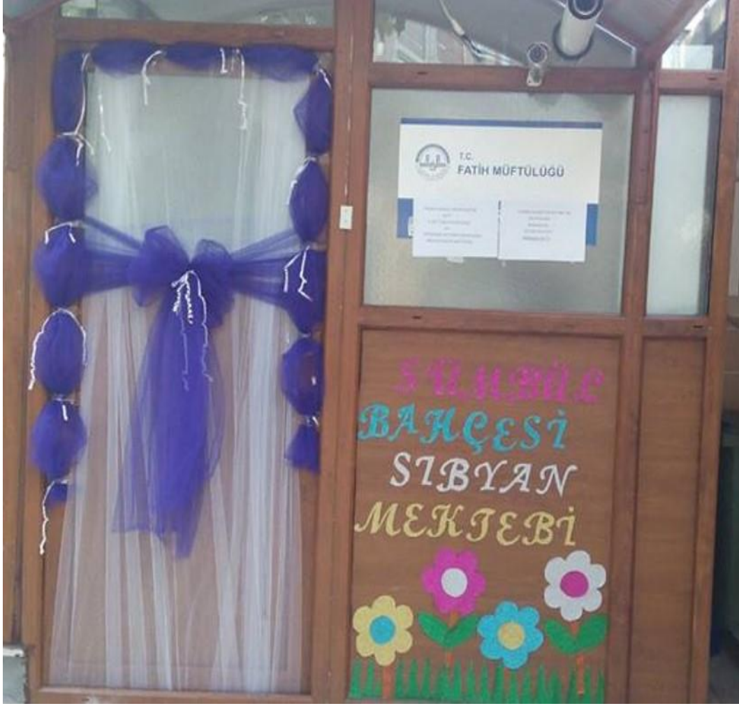
Ek 12. Fatih Müftülüğüne bağlı Sümbül Bahçesi Sıbyan mektebi'ne ait fotoğraf.