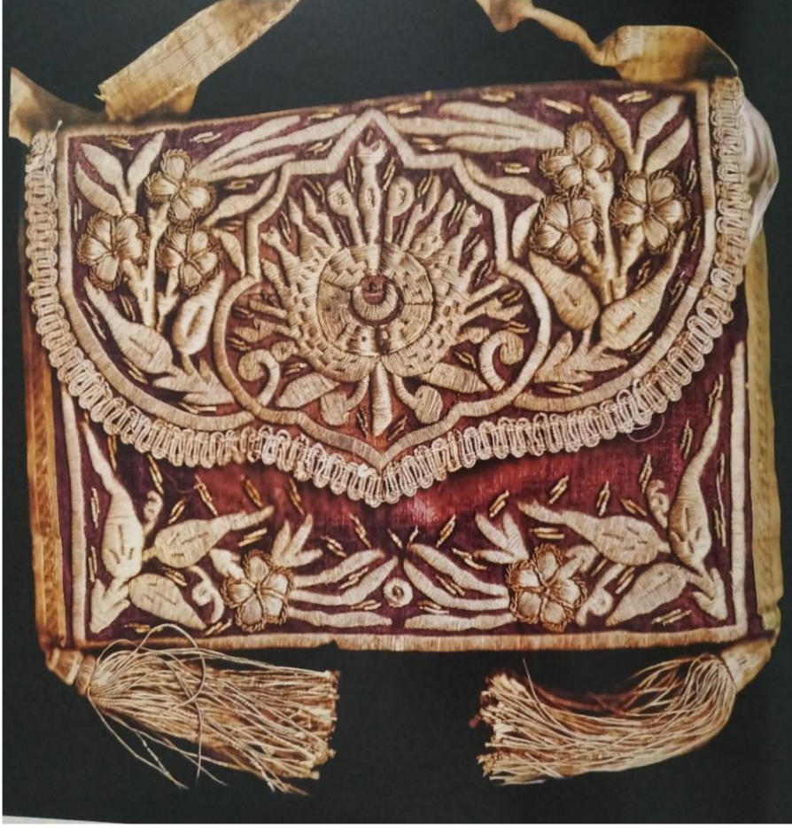
Ek 4. Cüz Kesesi (Fatih Güldal'ın Elifba'dan Muallime Mahalle Mektebi İsimli Eserinden)