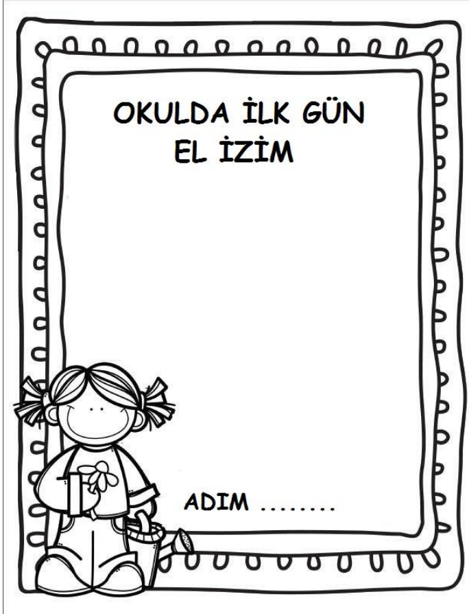
Ek 18. Genellikle Kullanılan Uygulama Kağıdı Bu Şekildedir.