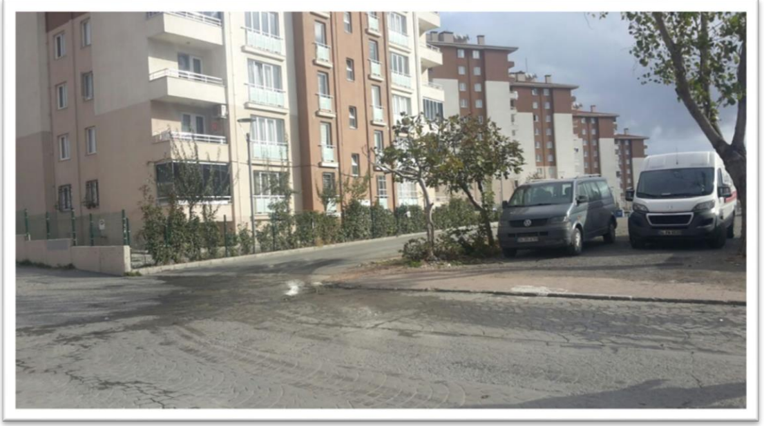
Şekil 2: Turgut Reis Mahallesi Kentsel Dönüşüm Sitesinin Dış Görüntüsü

Çalışmanın bu bölümünde, giriş kısmında sunulan amaç ve hipotez doğrultusunda yapılan derinlemesine mülakatların sonuçları analiz edilip tartışılmıştır. Sorulan sorular sonucunda elde edilen veriler başlıklandırılarak çalışmanın daha iyi anlaşılması sağlanmaya çalışılmıştır.