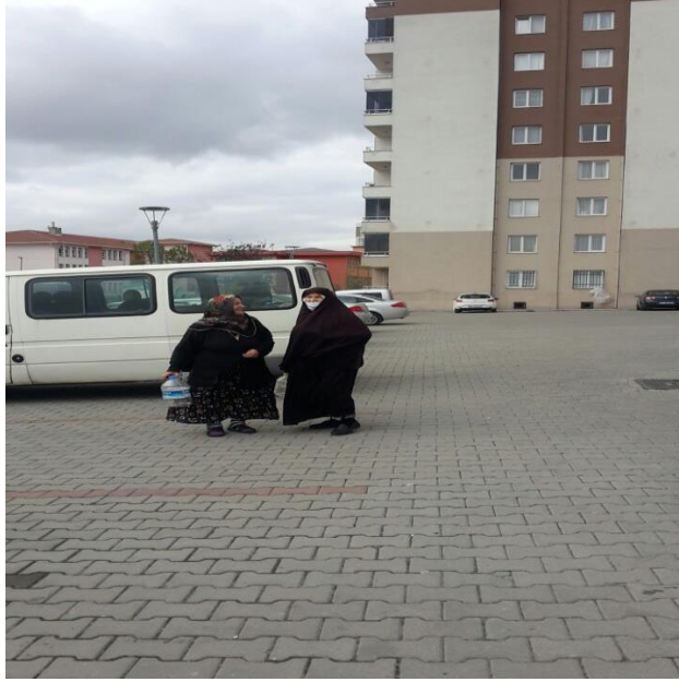
Şekil 3: Turgut Reis Mahallesi Kentsel Dönüşüm Sitesinden Bir Kare

Farklı kimlik ve yaşam tarzlarının yer aldığı sitede, alandaki güç mücadelesi ve ilişkiler ağı, tutum ve davranışlar, bedensel bakım ve giyim üzerinden gösterilebilmektedir. Ekonomik ve kültürel sermaye bireylerin yaşam tarzlarını, giyim tarzlarını belirleyen önemli etkenlerdir. Yaşanılan mekân ve aile yapısı bireyin habitusu olan beğenilerini ve tercihlerini, sermaye çeşitliliği ve miktarını şekillendirmektedir.