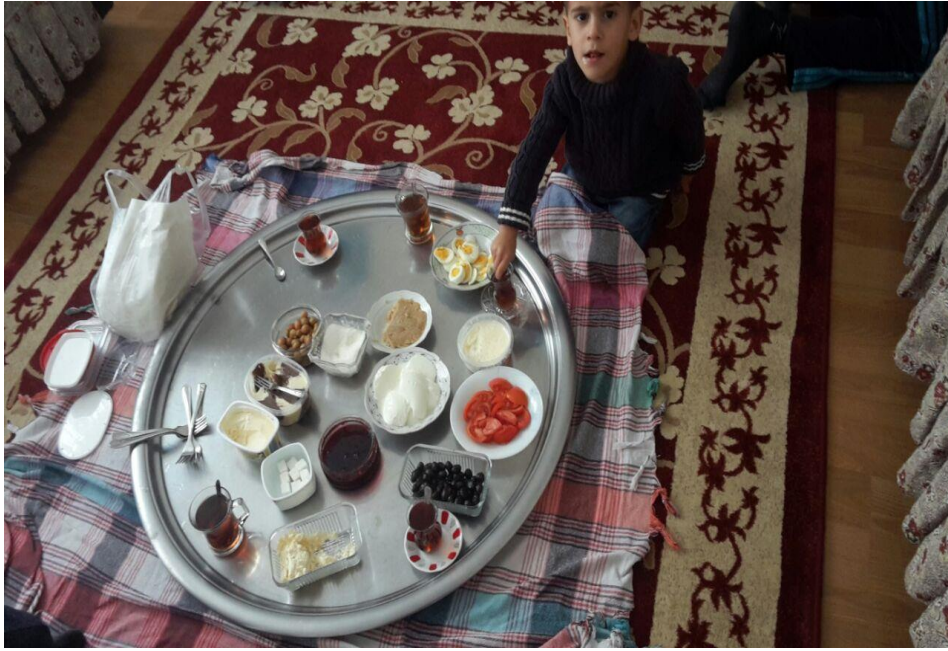
Şekil 4: Turgut Reis Mahallesi Kentsel Dönüşüm Sitesinde Misafir Olunan Bir Hane

Farklı tüketim çeşitleri tüm olası toplumsal kullanımlarda çok az “tek anlamlı” ürün olabilmektedir. Örneğin pirinç her sınıf tarafından farklı olarak pişirilmektedir: halk sınıfına ait olan sütlaç ya da pilav, burjuvada veya entelektüel kesimde “körili pilav” şeklinde yaşam tarzını yansıtan bir şemadır. Belirli kullanım içerisinde üretilmiş rejim ekmeği veya geleneklerden çay veya fiyatından dolayı havyar gibi belli sınıflar ile ilişkilendirilmiş ürünlerin çoğu, toplumsal değerlerini, toplumsal kullanımları içinde kazanmaktadır. Fotoğraf çekme üslupları (aile fotoğrafı veya halk oyunları fotoğrafı), yemek pişirme üslupları (yemeğin pişirme zamanına, hızına, parasına bakılmaksızın düdüklüde veya tencerede pişirme), dana burginyon veya körili pilavı dikkate almak gerekmektedir. Bu sebeple tek anlamlılık içeren kelimeler veya şeyleri, tam anlam kazandıkları toplumsal kullanımlarıyla araştırmada incelemek kültürel tüketimi anlamak için kolaylık sağlayacaktır (Bourdieu, 2015a, 39).