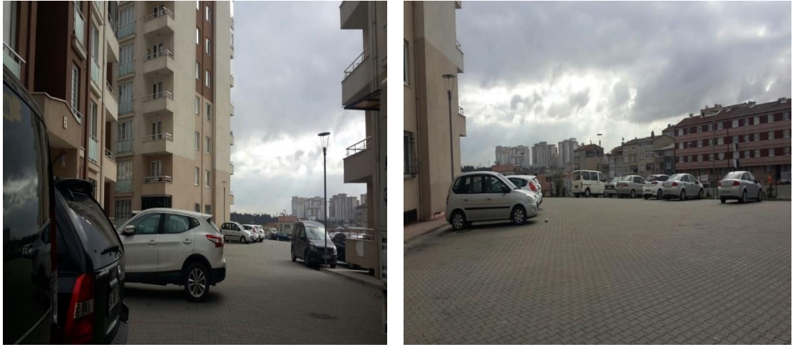
Şekil 7: Turgut Reis Mahallesi Kentsel Dönüşüm Sitesinde Arabaların Park Edildiği Boş Alan

Eskiden yukarıdan veya dışarıdan gelecek bir güvenliğe ihtiyaç duyulmuyordu. Sosyal güvenlik bir ilerleme olarak sunuluyordu. Oysa bu durum aktif ve sorumlu halkı, bir suç ya da kaza olduğunda hiç kımıldamadan polisi bekleyen, sosyal destek gören pasif insanlar topluluğuna dönüştürmektedir. İçinde taşıdığı dayanıklılığı ve gücü yitiren gündelik hayat, parçalanmış mekânlar gibi un ufak haline gelmektedir. Keyif alınan birçok şey yitirilmektedir (Lefebvre, 2013, 15). “Sosyal güvenliğin” birçok mekânda işlerliğini kaybettiği günümüzde güvenlik sistemi bir ihtiyaç haline