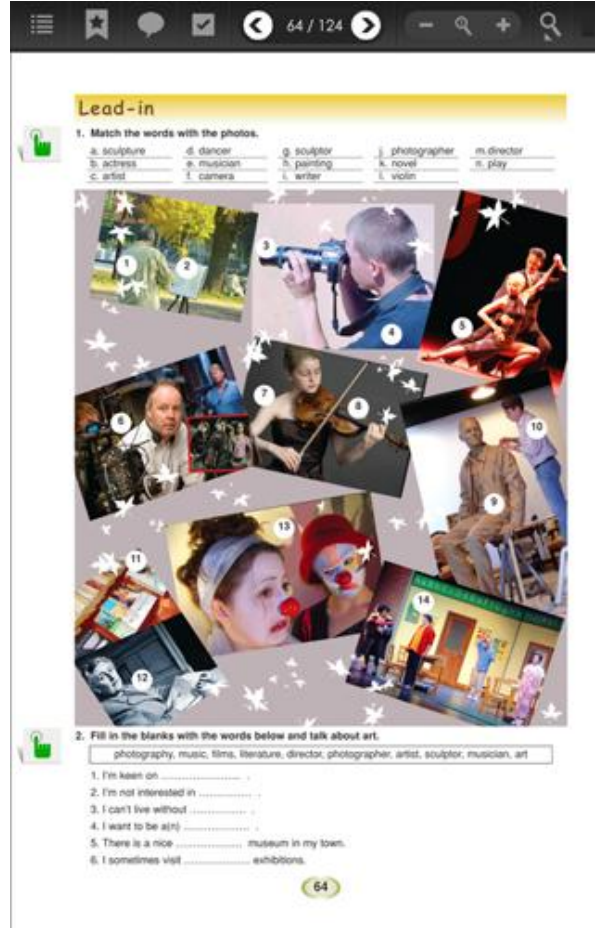
Şekil 5. 1 İncelenen z-kitaptan bir görüntü